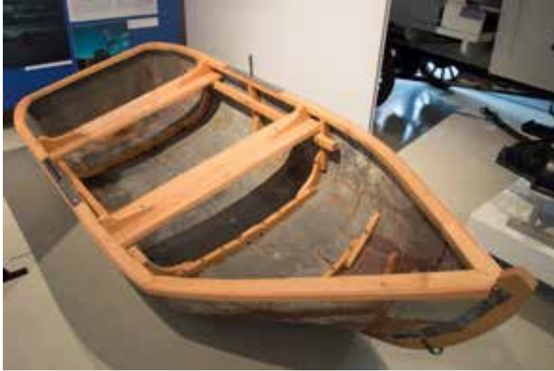
Járnbátur frá Kaldárholti, 2017.