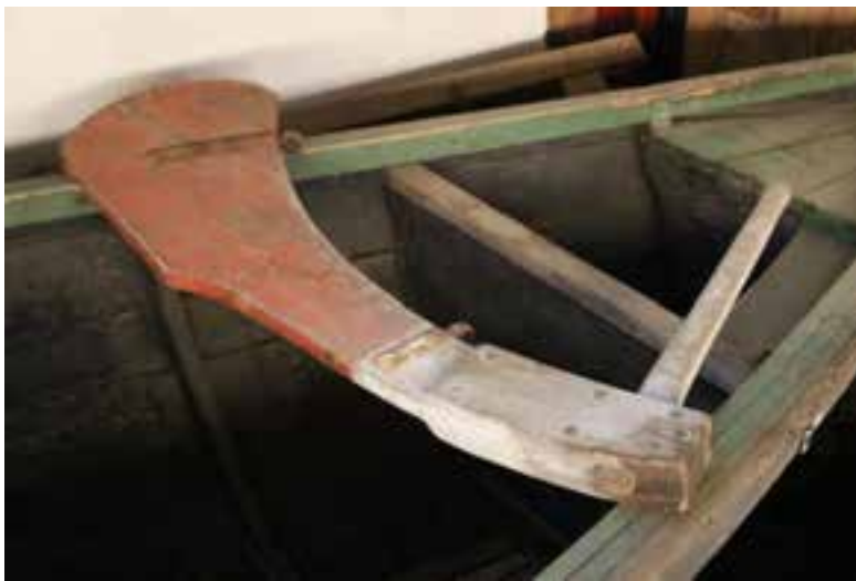
Stýrið á Fortúnu. Ljós. HMS 2017

Síðasta útróðraskip Austur-Eyfellinga. Heillegur.