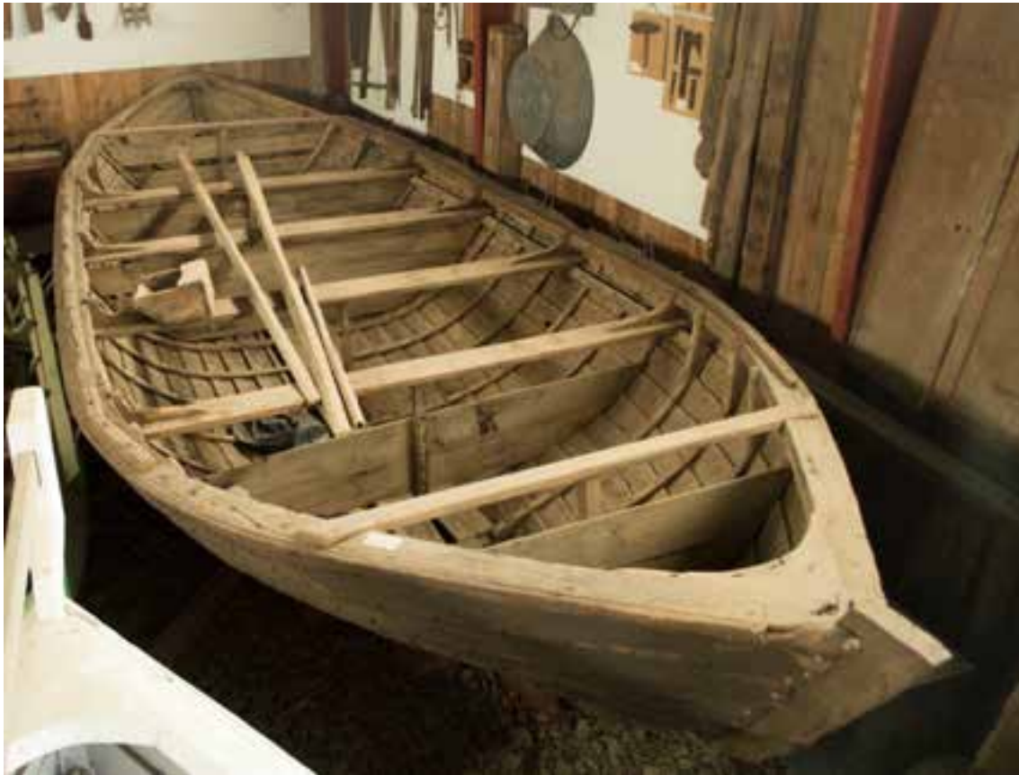
Farsæll II, 2017.