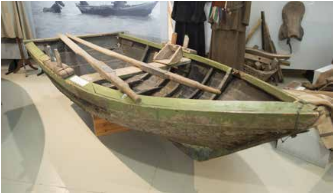
Ferjubátur frá Króki eða Syðri-Fljótum á Skógasafni, 2017.