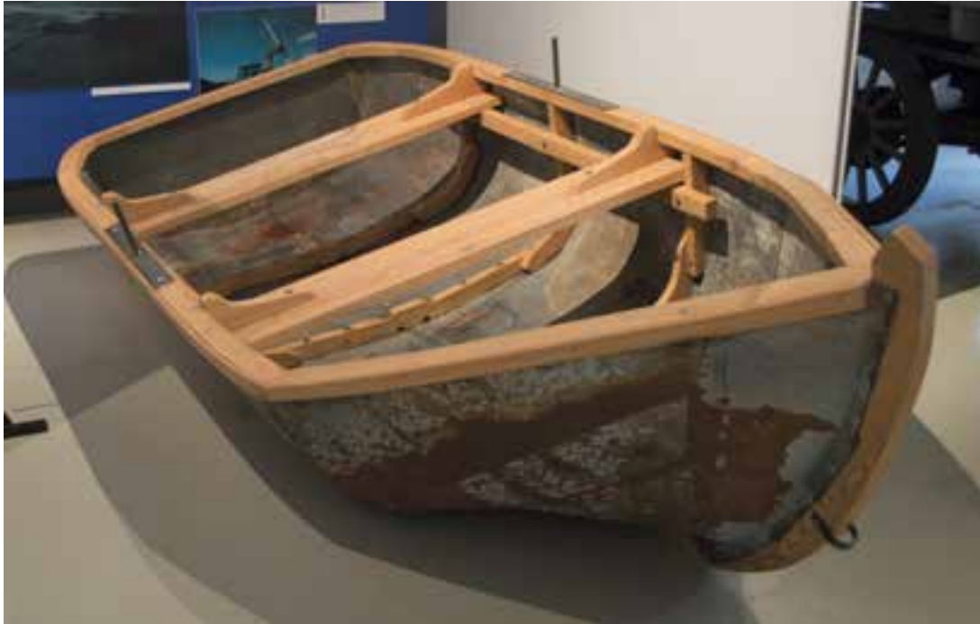
Járnbátur frá Kaldárholti á sýningu Skógasafns, 2017.