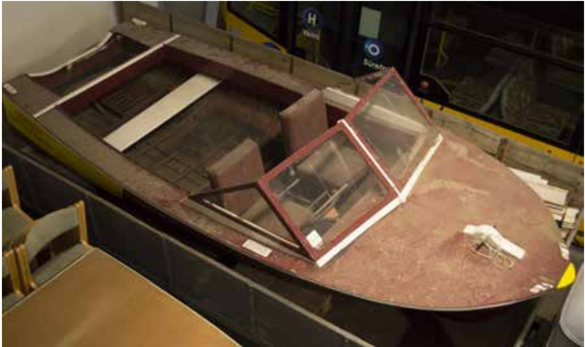
Hraðbáturinn Hrugnir, 2017.