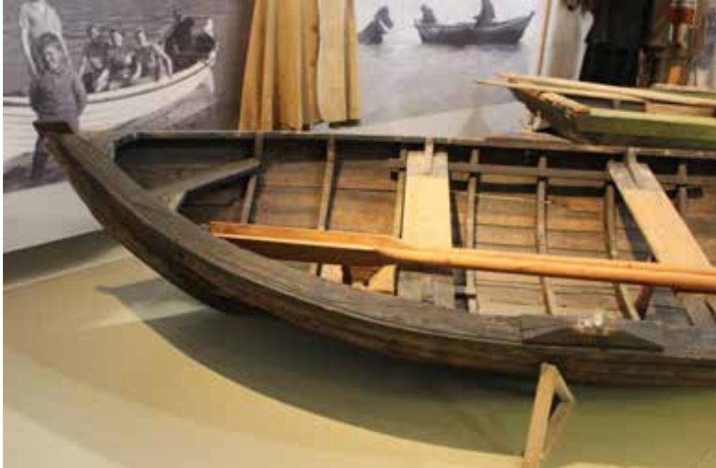
Ferjubátur frá Tungnaá, 2017.

Búnaður: Tvær þóftur og tvö ræði (keipar) ásamt tveimur árum.