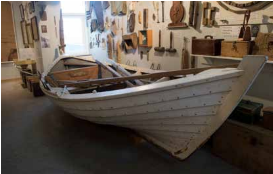
Farsæll á sýningu Skógasafns, 2017.