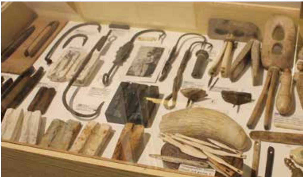
Veiðarfæri á Skógasafni. Ljós. HMS 2017