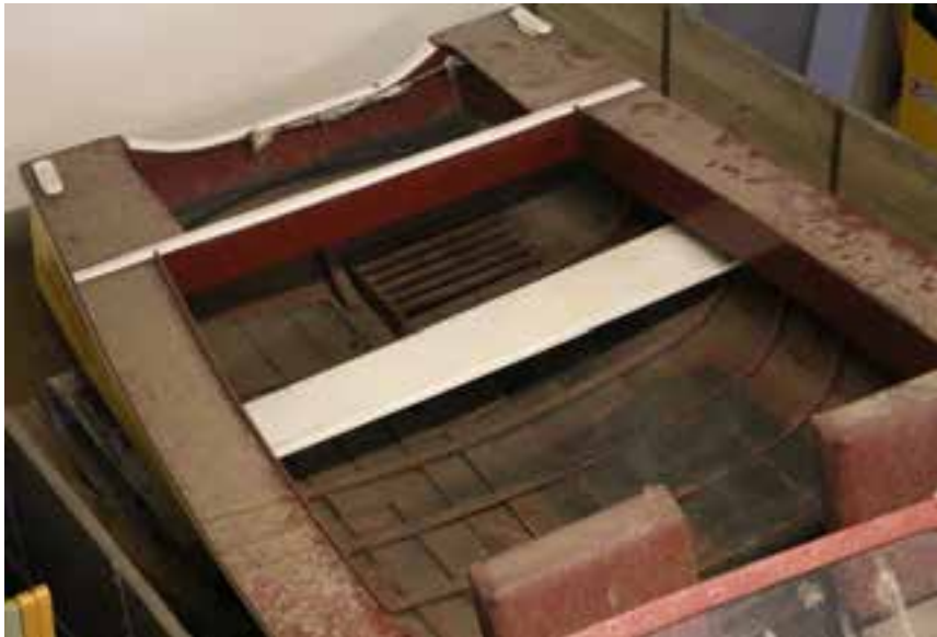
Séð ofan í Hrugni, 2017.

Báturinn hefur fremur lítið varðveislugildi.