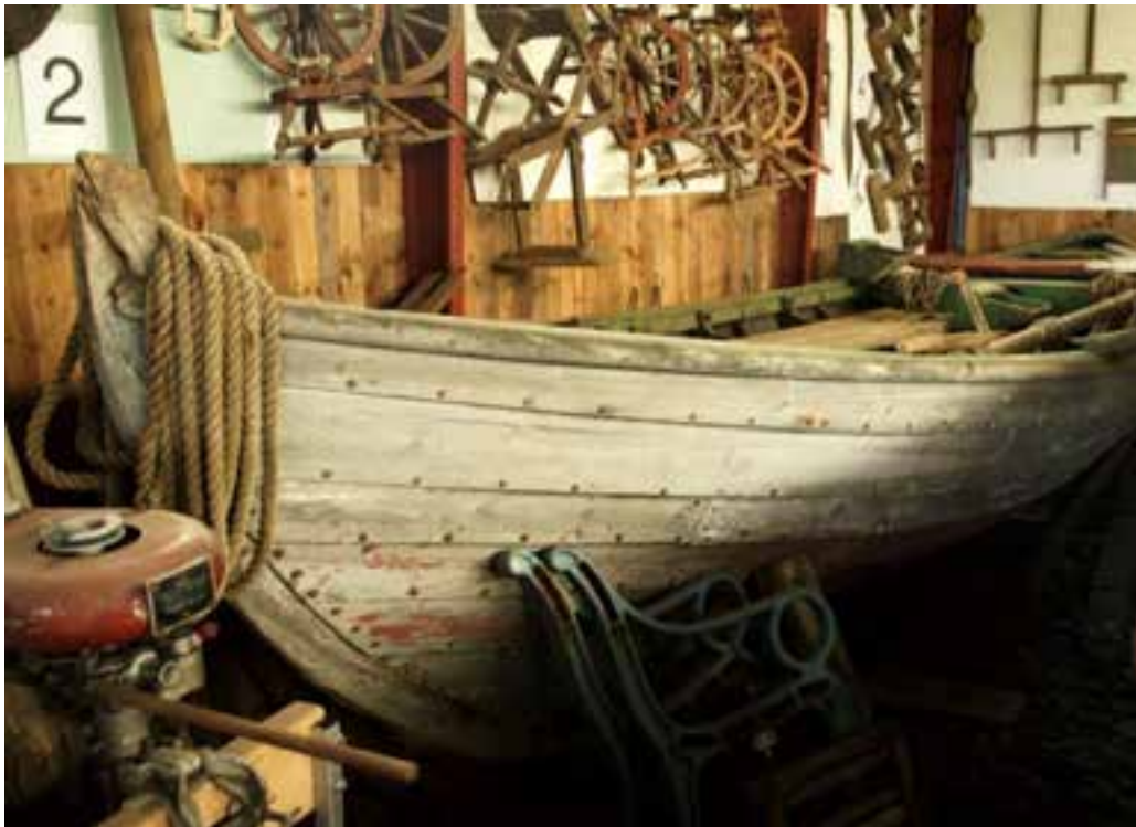
Fortúna á Skógasafni, 2017.

Bátnum fylgir farviður, þar með mastur og bóma, seilarnálar, skipsöxi o. fl., einnig tvær sjóbrækur úr gúmmíslöngum (?). 12