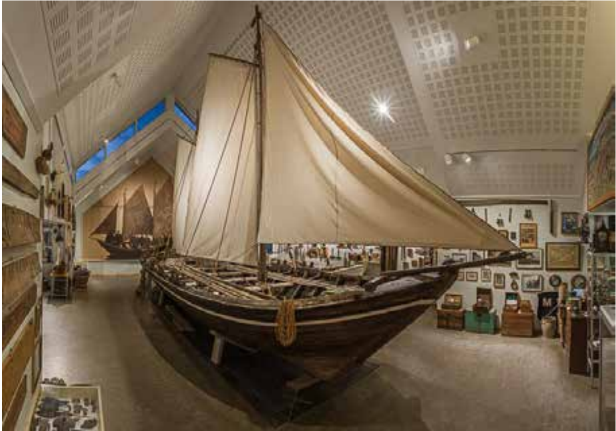
Pétursey, 2017.