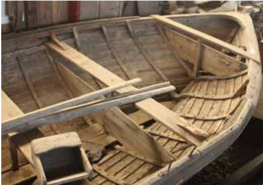
Farsæll II, stefni, 2017.