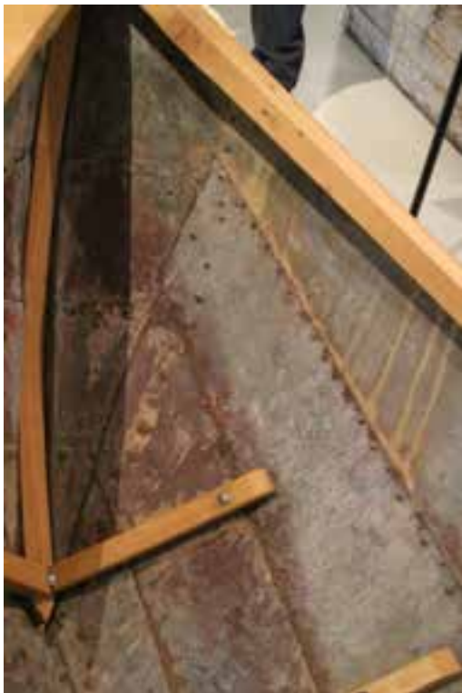
Járnbátur frá Kaldárholti, 2017.