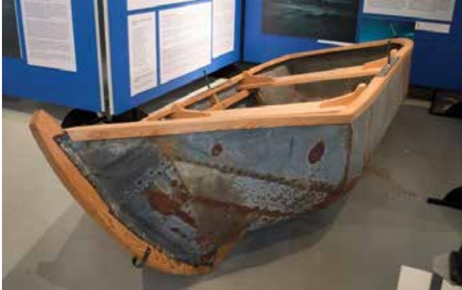
Járnbátur frá Kaldárholti, 2017.

Fossafélagið Títan var merkilegt fyrirtæki þótt það væri umdeilt. Vel er þess virði að varðveita þennan bát til minningar um það.