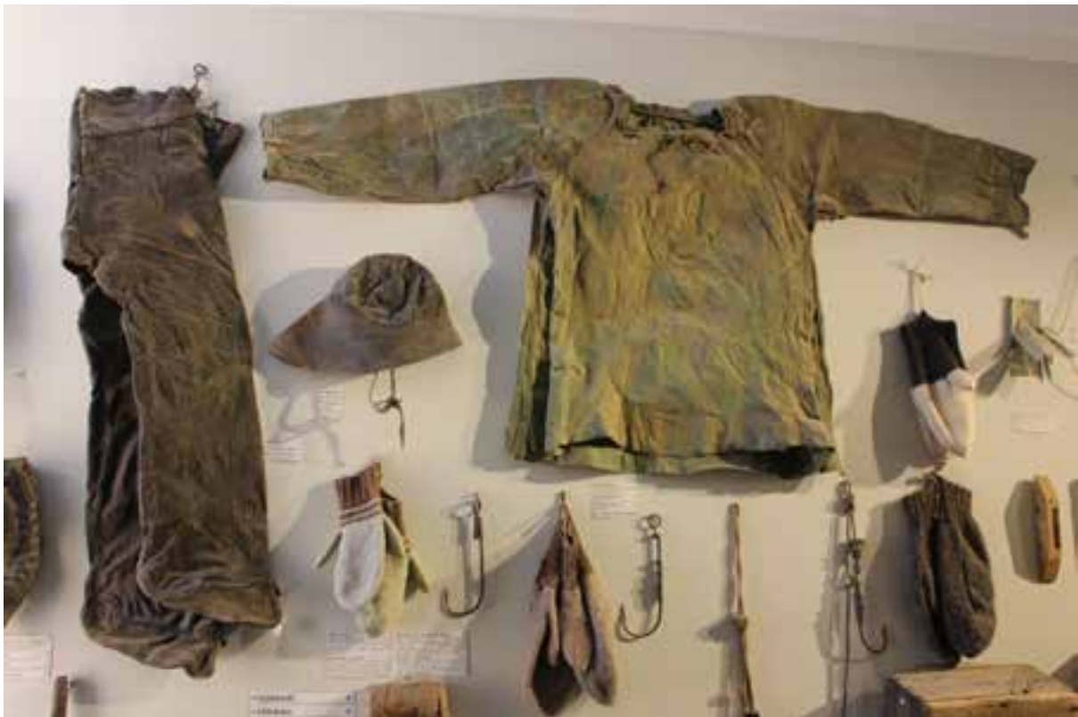
Sjóklæði á sýningu Skógasafns, 2017. Ljós. HMS