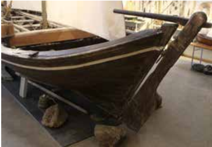
Afturstefni Péturseyjar. Ljós. HMS 2017