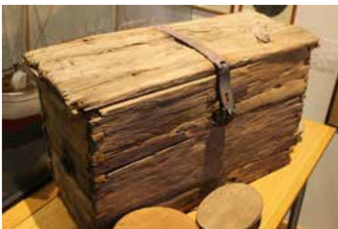
Verskrína sem fannst á Mælifellssandi 1968. Talin vera frá því um miðja 19. öld.