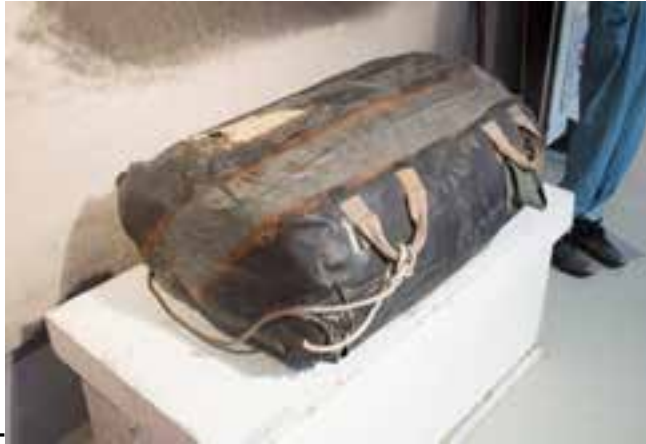
Þýskur björgunarbátur, 2017.