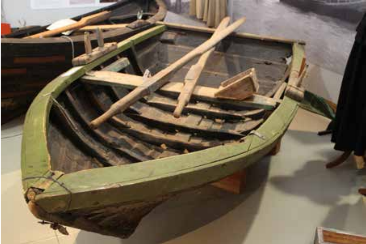
Ferjubátur frá Króki eða Syðri-Fljótum, 2017.