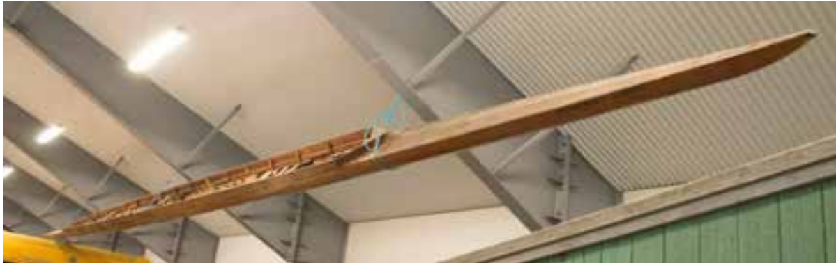
Kappróðrabáturinn Ormurinn langi, 2017.