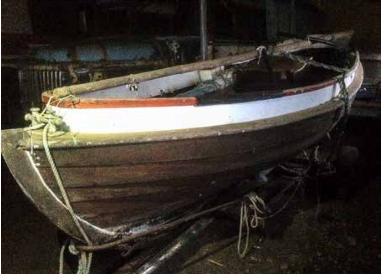
Björgunarbátur úr Polarquest, 2017.