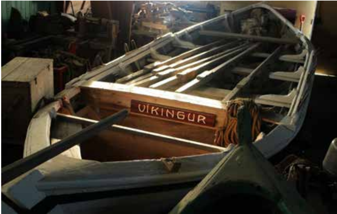
Víkingur, skutur. Ljós. HMS 2017