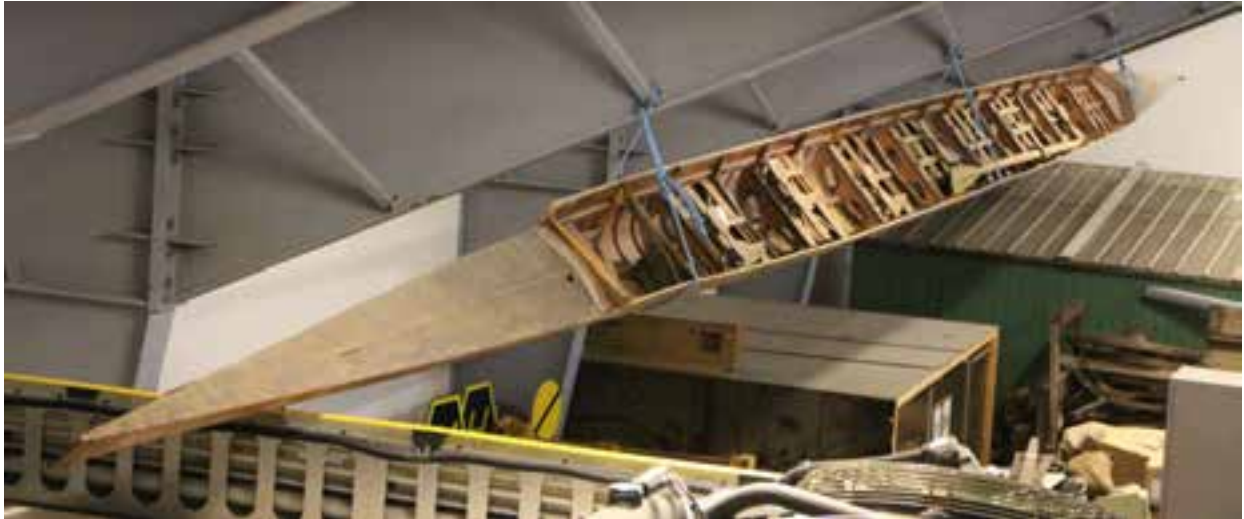
Kappróðrabáturinn Ormurinn langi, 2017.