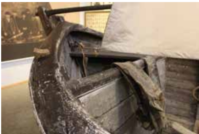
Skutur Péturseyjar. Ljós. HMS 2017