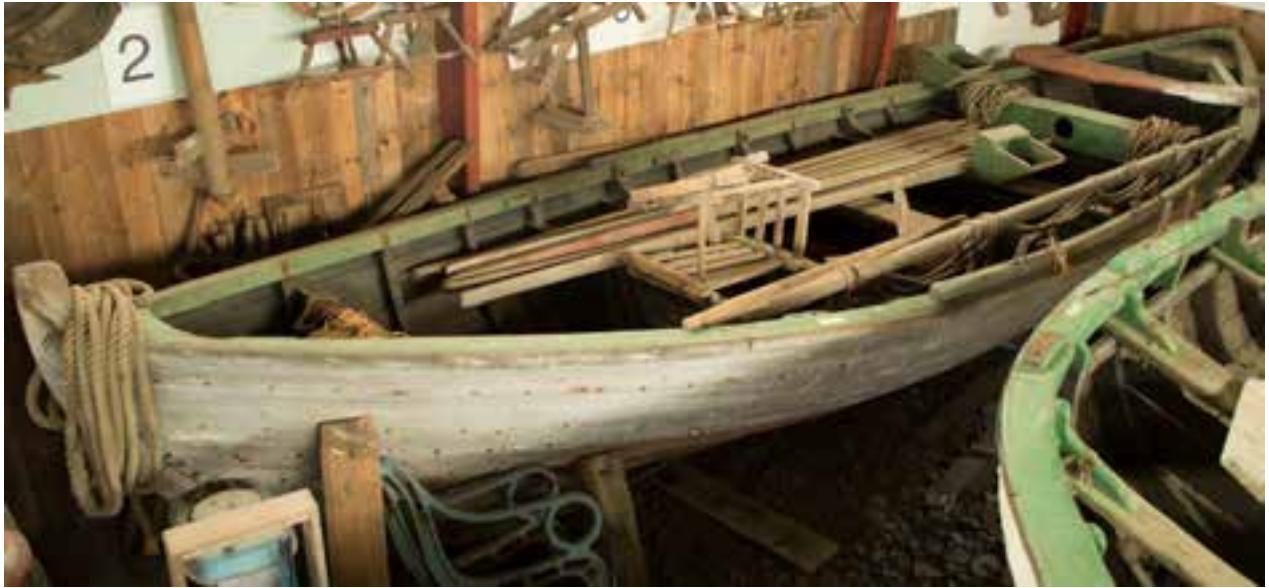
Fortúna, 2017.