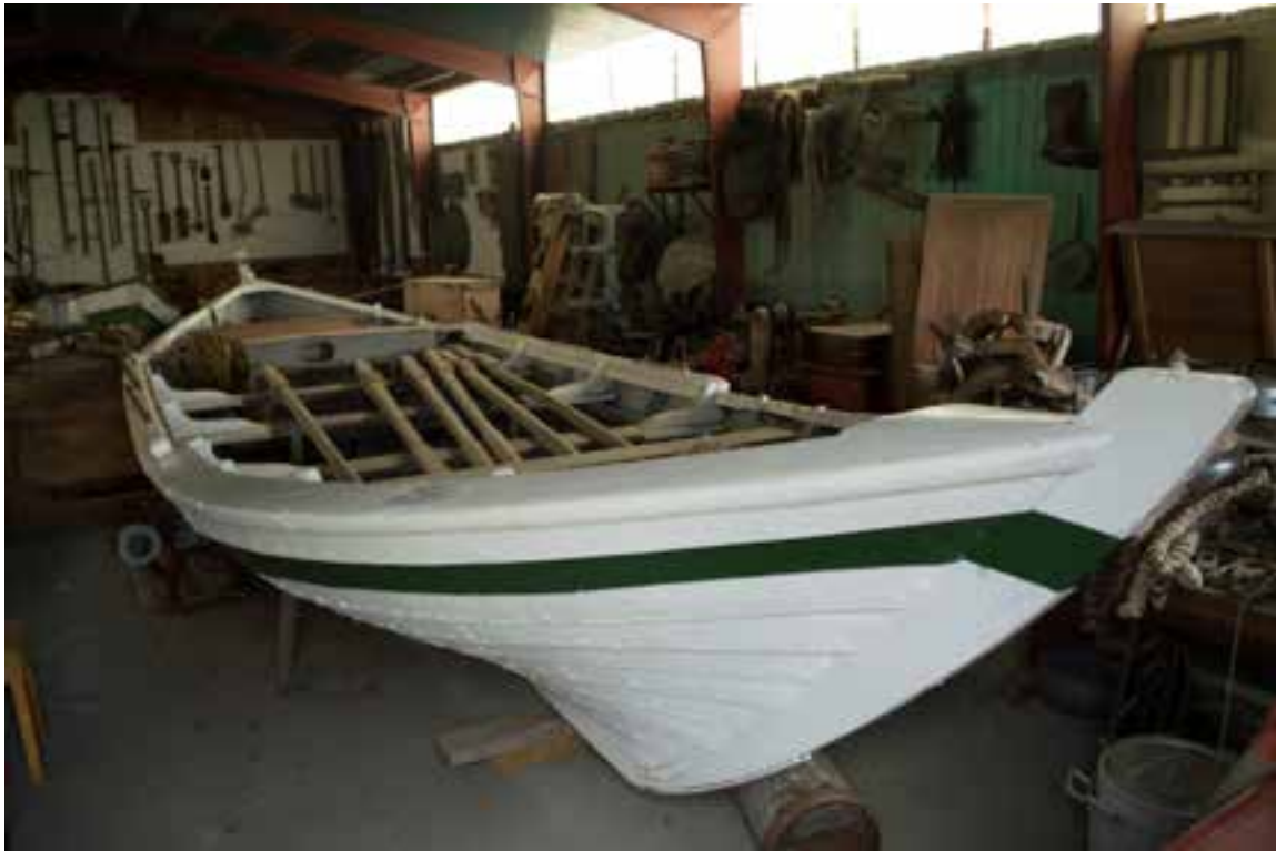
Víkingur á sýningu Skógasafns, 2017.