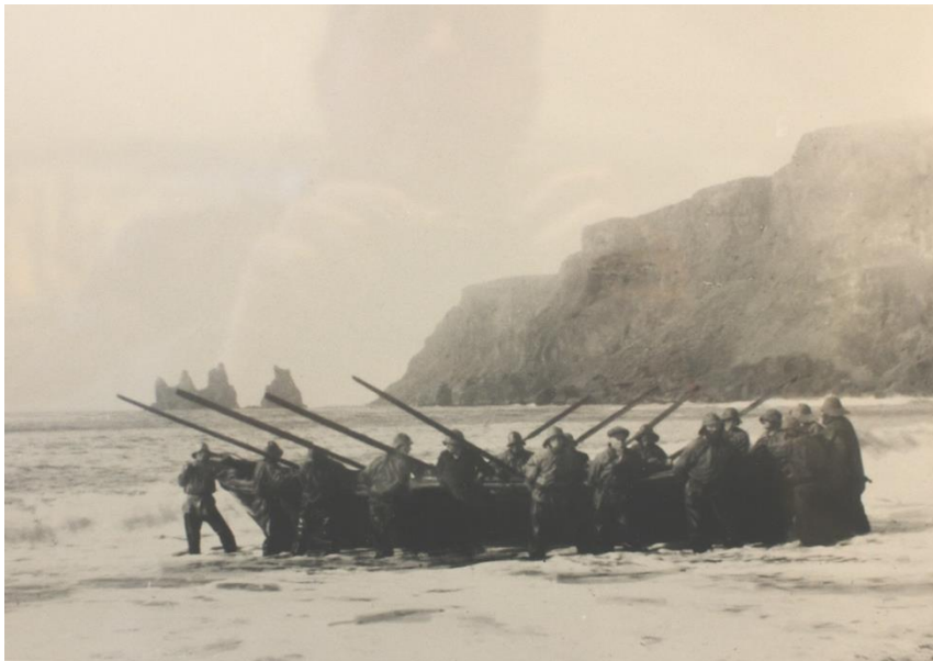
Pétursey á Víkursandi.

Segl fylgdu Pétursey ætíð meðan henni var haldið til veiða. 16 Hún er sýnd undir seglum á Skógasafni.