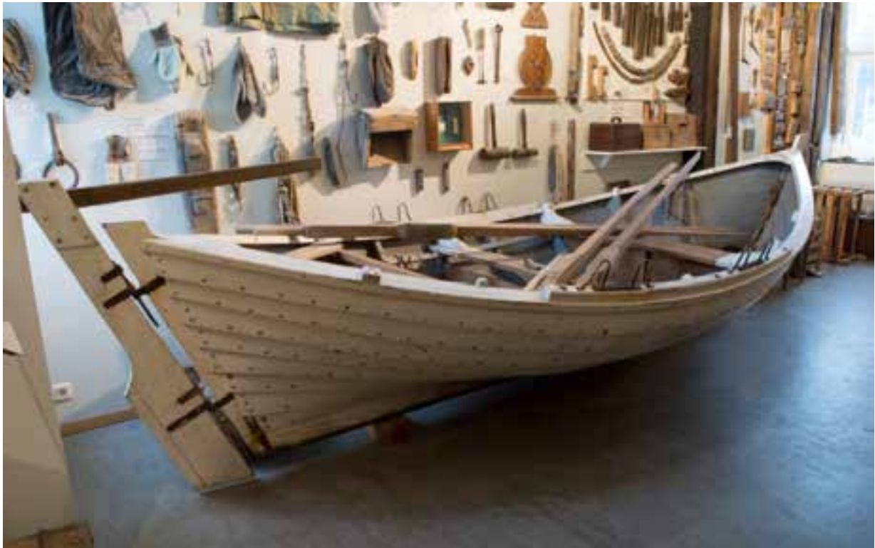
Farsæll á sýningu Skógasafns, 2017.