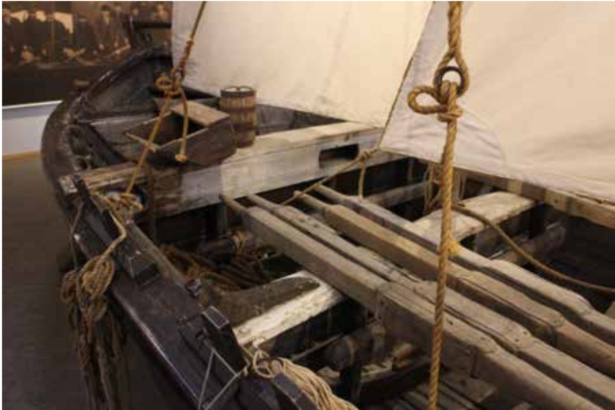
Séð aftur eftir Pétursey.