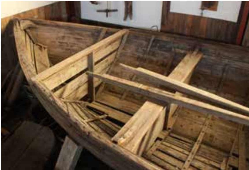
Farsæll II, skutur, 2017.

12. Smíðaeefni og samsetning skrokks: Fura og eik; súðbyrtur. Böndin eru úr eik.