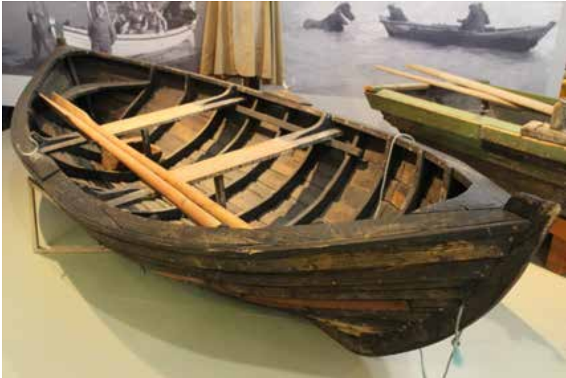
Ferjubátur frá Tungnaá á sýningu Skógasafns, 2017.