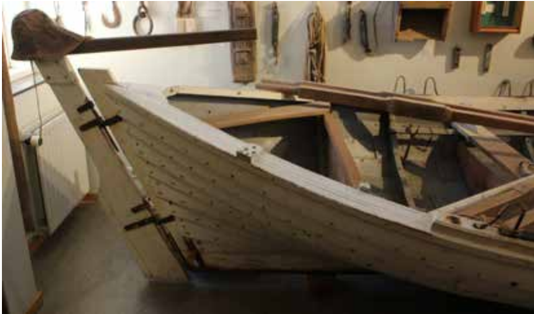
Farsæll, skutur. Ljós. HMS 2017

Hann er síðsti súðbyrðingurinn sem smíðaður er í sýslunni.