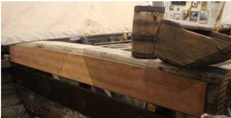
Bitafjöl með dróttkveðinni vísu, endurgerð, á Pétursey.