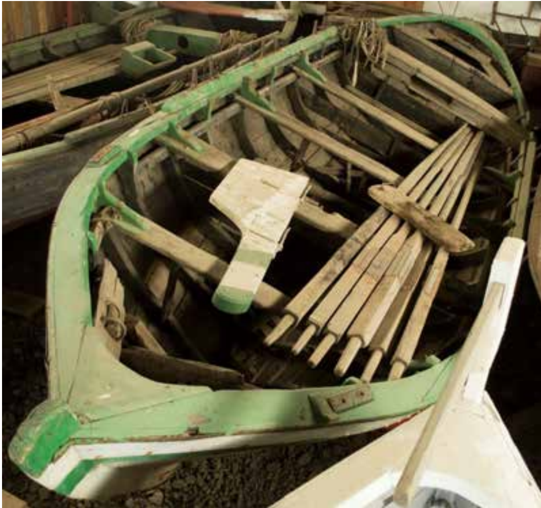
Lukkusæll á Skógasafni, 2017.