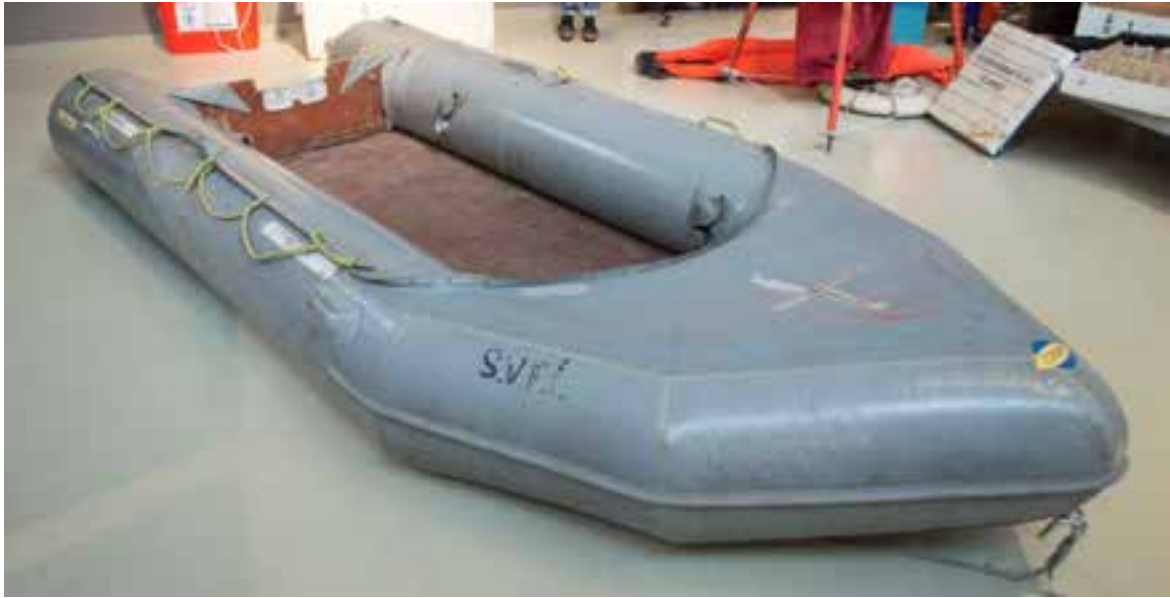
Gúmmíbjörgunarbátur frá Grindavík, 2017.